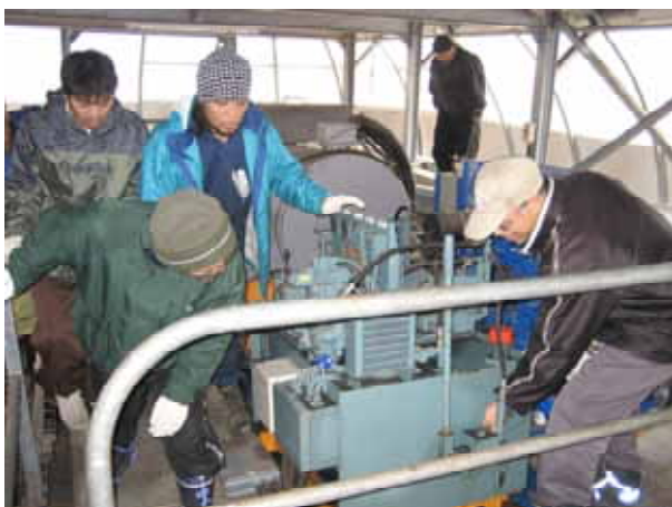
11月29日 予備原動機取扱訓練