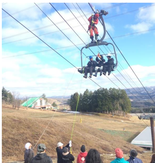
救助訓練のようす